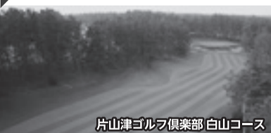
片山津ゴルフ倶楽部 白山コース