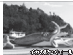
イカの駅つくもール