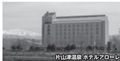
片山津温泉 ホテルアローレ