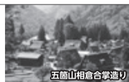
五箇山相倉合掌造り

⇒ 世界遺産・五箇山相倉合掌造り ⇒ 国宝高岡山「瑞龍寺」 ⇒ 海鮮問屋「柿の匠」昼食 ⇒ 能作(工場見学) ⇒ ホテルアローレ(さよならパーティー会場 17:50)