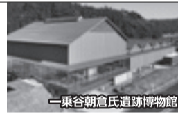
一乗谷朝倉氏遺跡博物館

⇒ 羽二重餅のふる里マエダセイカ(工場見学) ⇒ 一乗谷朝倉氏遺跡博物館(新博物館オープン) ⇒ 大本山永平寺見学と昼食 ⇒ 山中温泉(鶴仙溪・ゆげ街道散策) ⇒ ホテルアローレ(さよならパーティー会場 17:10)